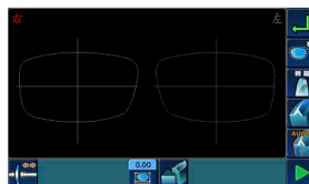
Interface simples e intuitiva