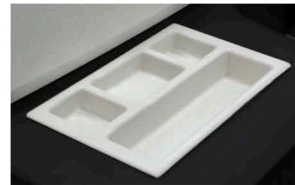
Armazenamento Recipiente de armazenamento externo para facilitar a organização.