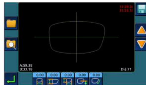
Alteração de formato O formato escaneado pode ser mudado (aumentar, diminuir, alterar bordas superior/inferior)

Controle da posição do bisel (Automático, 33%, 55%, etc.)