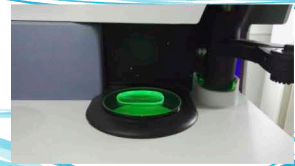
Precisão e velocidade Scanner óptico de precisão com alta velocidade de digitalização.